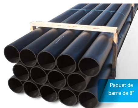
Paquet de barre de 8"

2 Autres diamètres et DR disponibles sur demande.