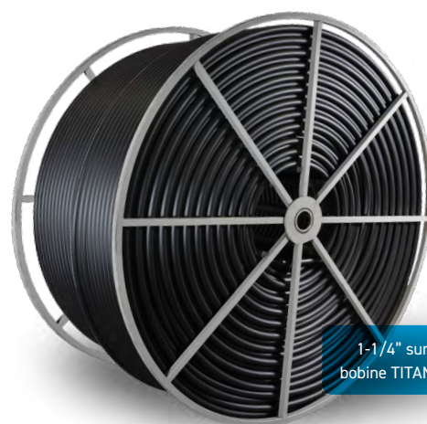
1-1/4" sur bobine TITAN MC

Références: Normes BNQ 3660-950 et 3624-027 — Normes ASTM D3350, F2620 ET F714 — Normes CSA B137.1 — ANSI/AWWA C901 et C906 — NSF 14 — Plastics Pipe Institute (PPI), http://plasticpipe.org/publications/pe_handbook.html