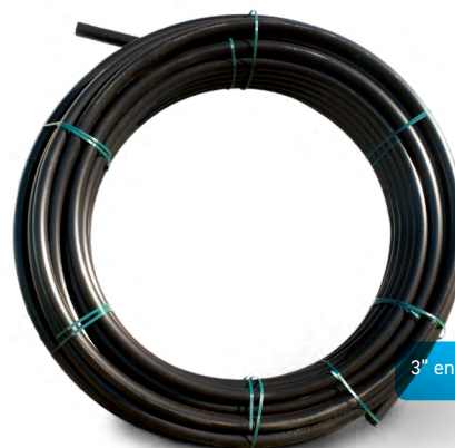
3" en rouleau