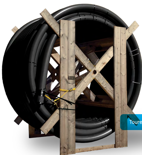
Touret de 6"