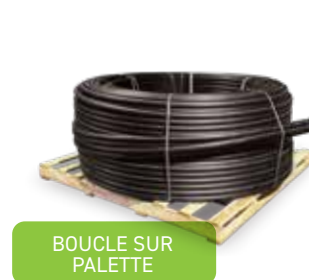
BOUCLE SUR PALETTE