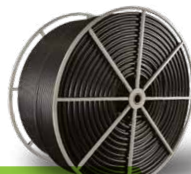
1 ½" sur BOBINE TITAN MC