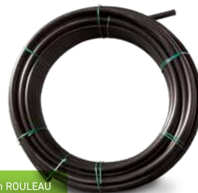
3" en ROULEAU