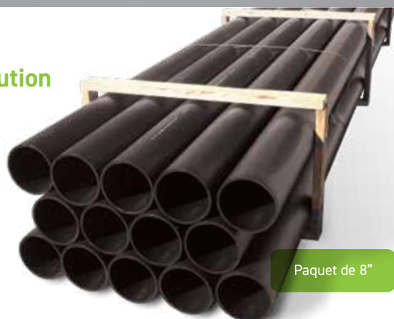
Paquet de 8"