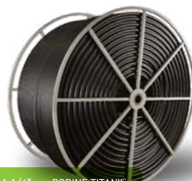
1-1/4" sur BOBINE TITAN MC