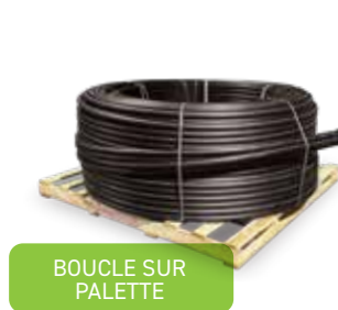
BOUCLE SUR PALETTE