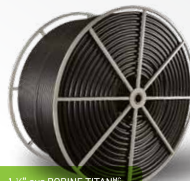
1 ½" sur BOBINE TITAN MC