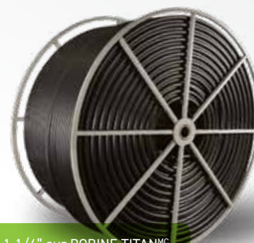
1-1/4" sur BOBINE TITAN MC