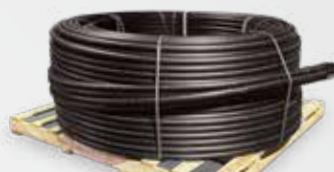
BOUCLE SUR PALETTE

Grâce aux raccords VERSAPOINT , la boucle de géothermie TWINLOOP est composée de deux boucles VERTICALLOOP, formant ainsi 4 conduits parallèles et deux boucles indépendantes. Elle double la surface de contact avec le sol, permettant de retirer plus d'énergie à chaque forage, pour plus d'efficacité et une réduction des coûts!