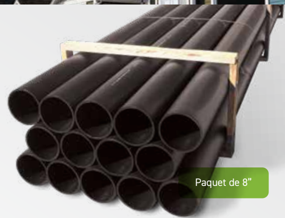
Paquet de 8"