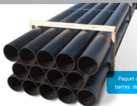
Paquet de barres de 8"