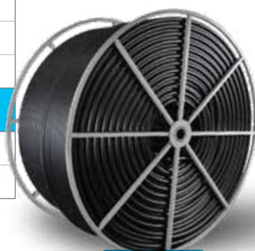
1-1/4" sur bobine TITAN MC