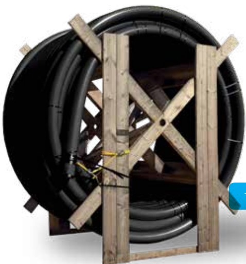
Touret de 6"