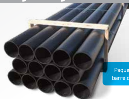
Paquet de barre de 8"

*Toutes autres longueurs spéciales disponibles sur demande.