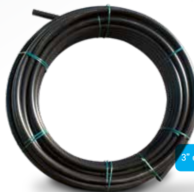
3" en rouleau