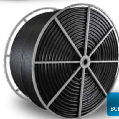
1 ½" sur BOBINE TITAN MC