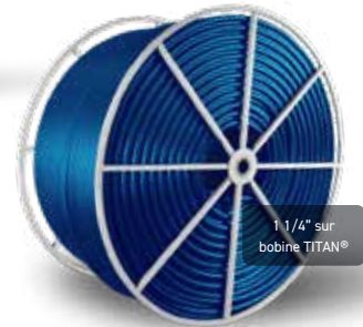
1 1/4" sur bobine TITAN®