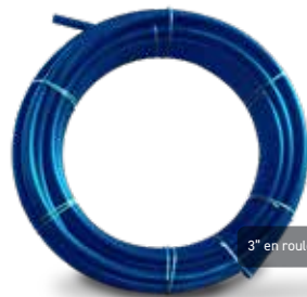
3" en rouleau